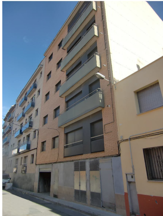
FAÇANA CARRER DE SANTA MAGDALENA 46