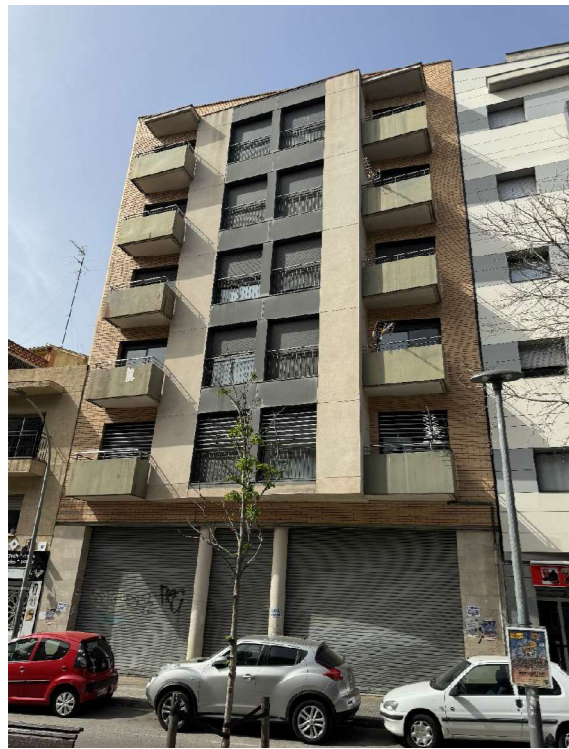
FAÇANA RAMBLA FRANCESC MACIÀ 39